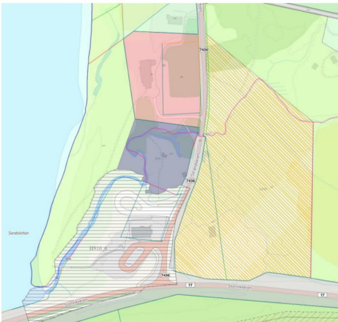
Utsnitt fra kommuneplanens areadel

Området som inngår i reguleringsplanen er i gjeldende kommuneplanens arealdel avsatt til bygge- og anleggsformål med krav om regulering, samt offentlig eller privat tjenesteyting og friluftsliv- og turistformål. Reguleringsplanen ansees å være i tråd med overordnet plan, vedtatt 01.03.2016.